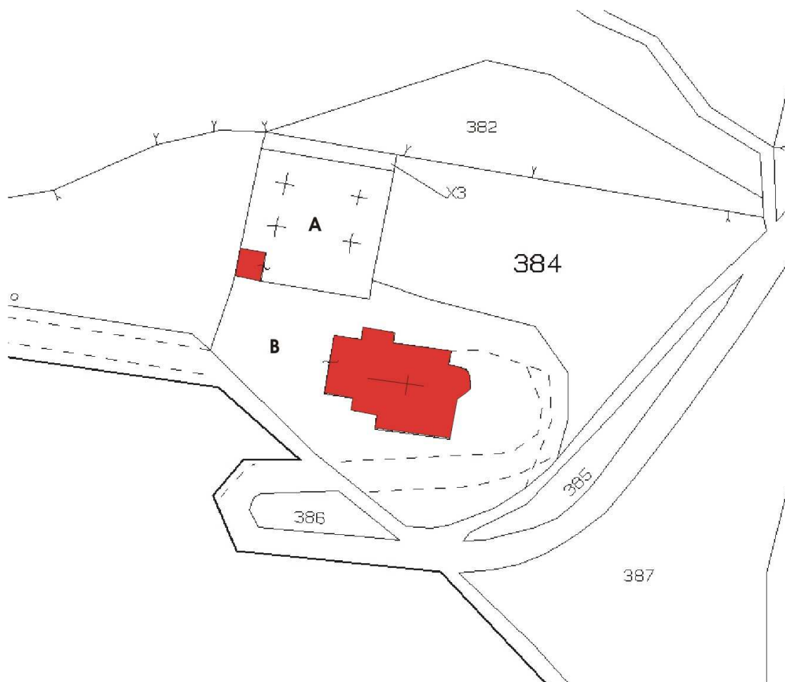
Stralcio di mappa catastale